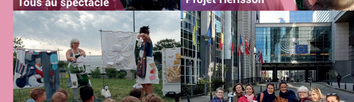
Conte pour la planète