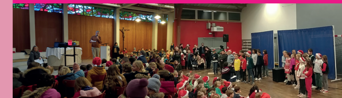
Célébration de Noël