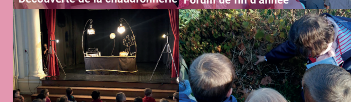
Tous au spectacle