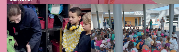
Découverte de la chaudronnerie