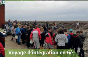
Voyage d'intégration en 6è