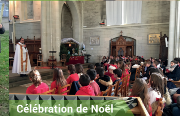
Célébration de Noël