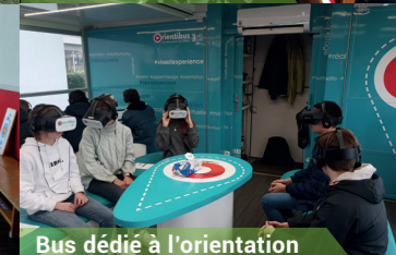
Bus dédié à l'orientation