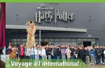
Voyage à l'international