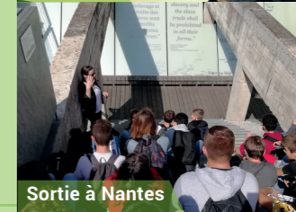
Sortie à Nantes